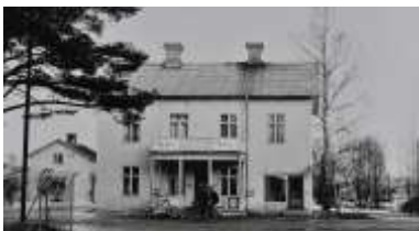
Café Gulan, mittemot kasernvakten T 3.