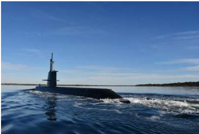
Marinen tillförs ytterligare en ubåt, varmed det totala antalet blir fem.

Det gäller hälso- och sjukvården, livsmedels- och dricksvattenförsörjningen, transportsektorn, samhällets ordning och säkerhet, finansiell beredskap, energiförsörjning samt elektroniska kommunikationer och post. Totalförsvarskonceptet kräver balans, varför det är av största vikt att civilt försvar prioriteras och successivt utvecklas.