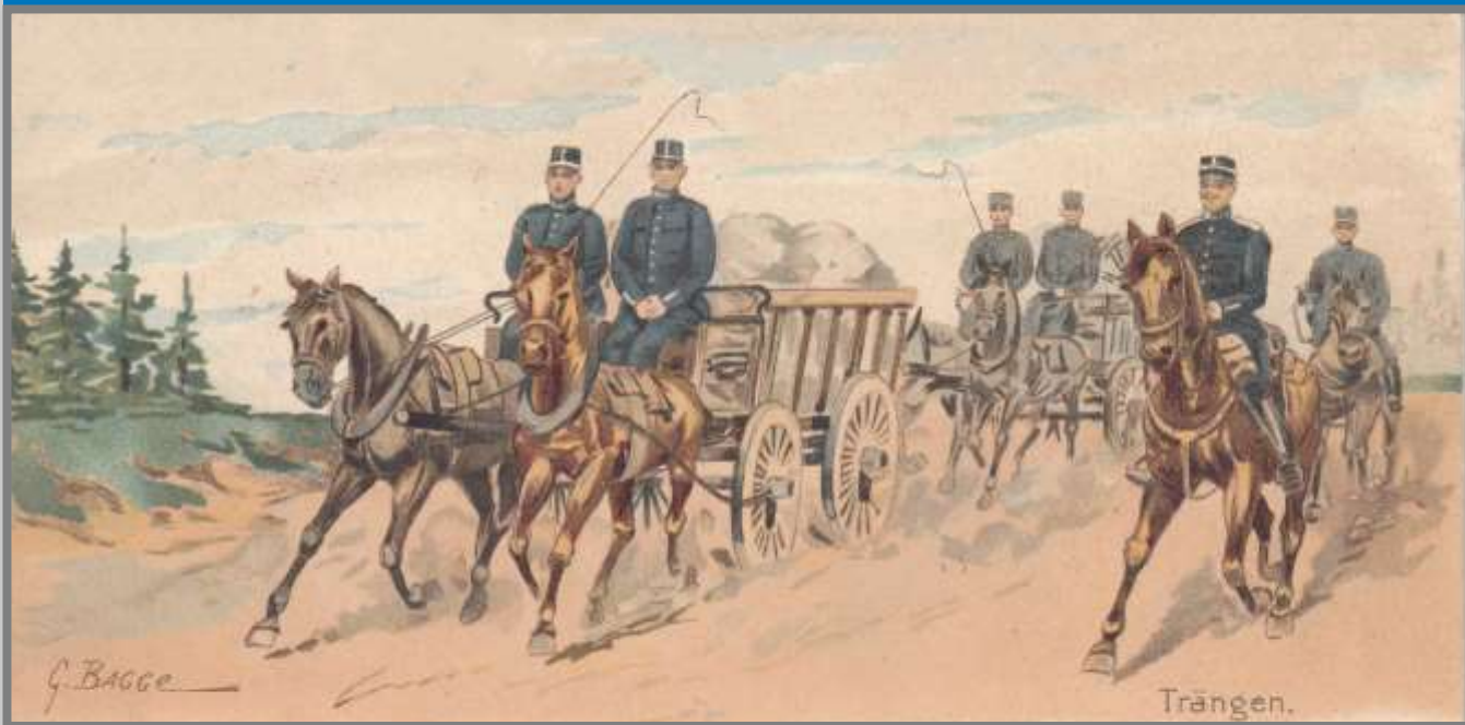
Vykort postat i Sollefteå 1902. Kortet ingår i en serie om Arméns olika truppslag och regementen.