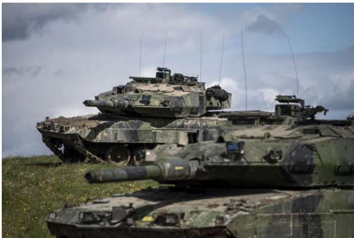
Armén stärks ordentligt i förhållande till nuläget.

Regeringens försvarsproposition för åren 2021-2025 röstades igenom av riksdagen 15 december 2020. Grunden är därmed lagd för en krigsorganisation som ska vara klar 2030. För att nå ambitionerna ökar försvarsbudgeten från 2020 med nästan 29 miljarder kronor till 89 miljarder 2025. För att genomföra förstärkningarna till 2030 behövs mer pengar efter 2025, vilket blir en fråga inför försvarsbeslutet 2026-2030.