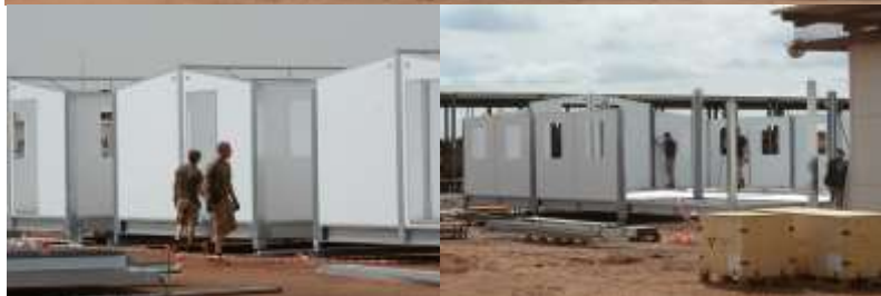
Lastning och uppbyggnad.

strävan till fred och uppbyggnad av landet, samt för de internationella styrkorna som finns på plats.