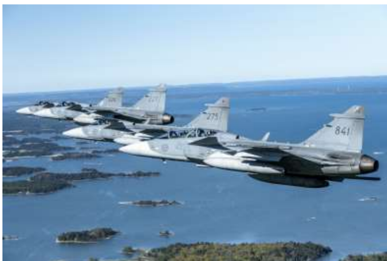
Flygvapnet kommer att innehålla sex stridsflygdivisioner.

ningar på det militära försvaret sker förstärkningar av cyberförsvaret och försvarsunderrättelseförmågan liksom en stegvis uppbyggnad av civilt försvar. Ett antal viktiga samhällsfunktioner ska stärkas.