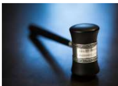
Gåva av Dag Nordenskjöld 1972.

Föreningens årsmötet skall enligt stadgarna ske första torsdagen i mars. Pga pandemin flyttas mötet prel. fram till torsdag 2 september.