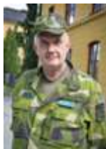
Kvm Anundsjö kompani