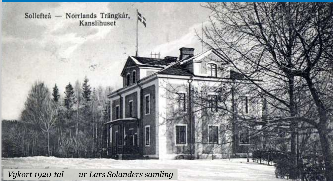
Sollefteå — Norrlands Trängkår, Kanslihuset