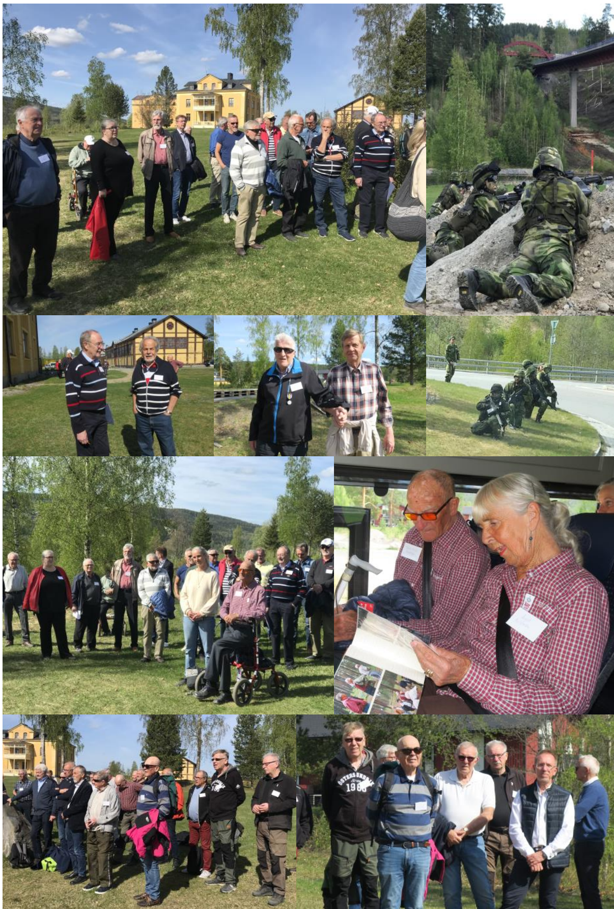
T 3-träff 2022