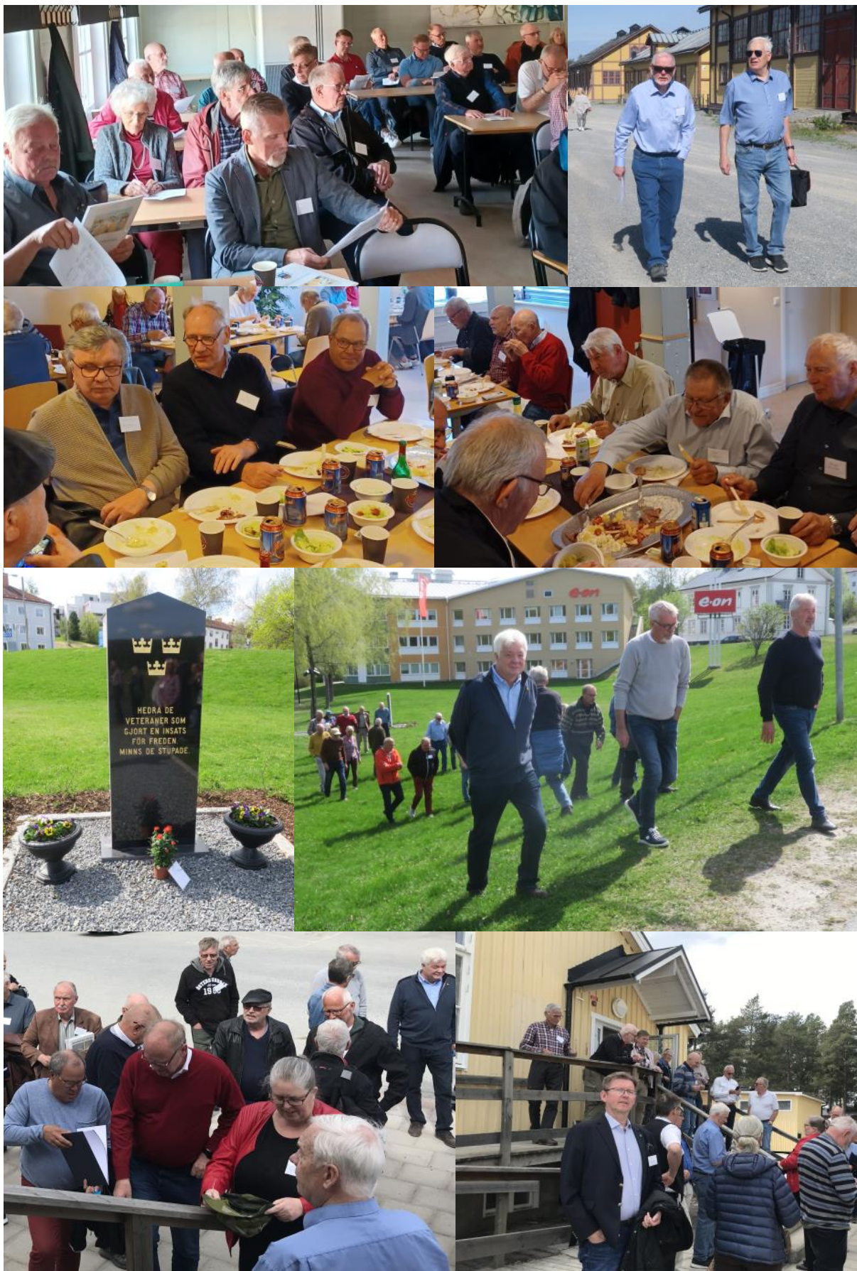
T 3-träff 2022