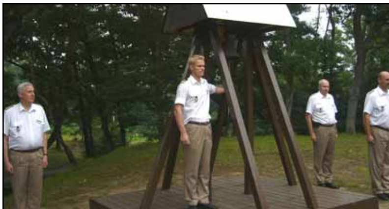
In och ut ringning i sb med midsommarfirandet

november och det var första gången sedan Koreakriget som ett civilt fartyg passerade detta känsliga område. Vår närvaro vid dessa ”navala” operationer bidrog kanske till att inga incidenter inträffade.