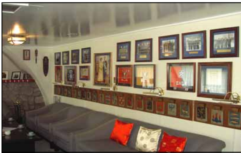
Svenska Klubben ( vardagsrum, mäss ). Om du är riktigt uppmärksam så kan skymta du landskapsvapnet för Ångermanland längst ner till höger.