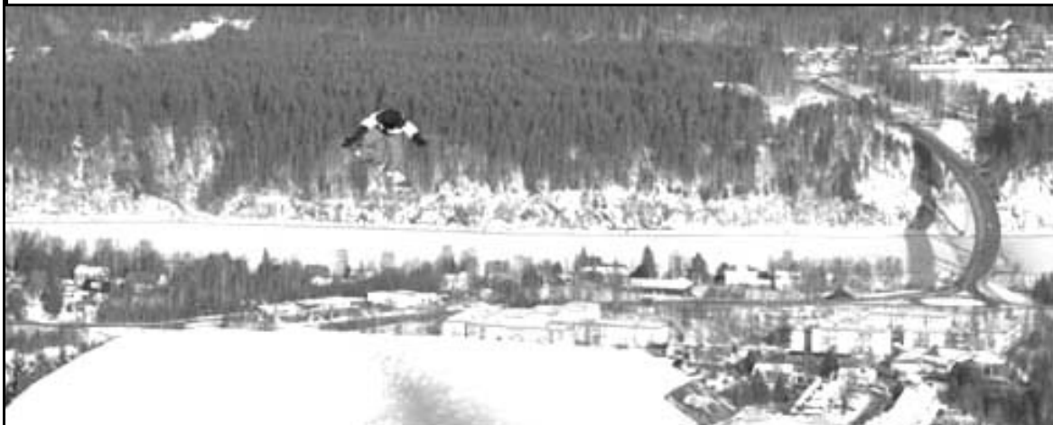
Bild från snowboardtävling på Hallsta. Till höger ser ni den nya bron över älven. Det norra brofästet ligger omedelbart väster om "Exercishuset"

”- Sollefteå befinner sig i en härlig tid just nu med utveckling, framåtanda och ökad handel, och trenden håller i sig.”