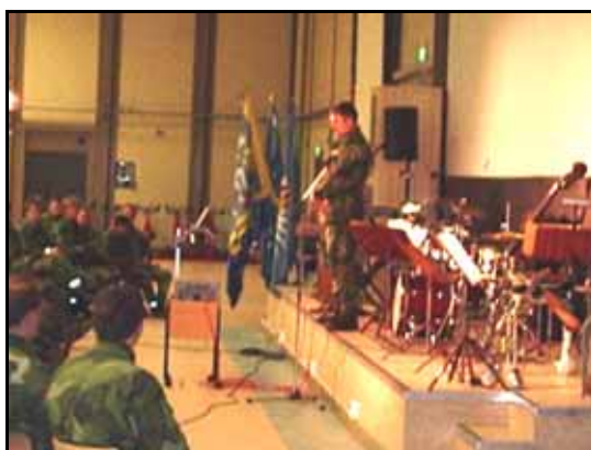
C I 5 tal till soldaterna i samlingsalen