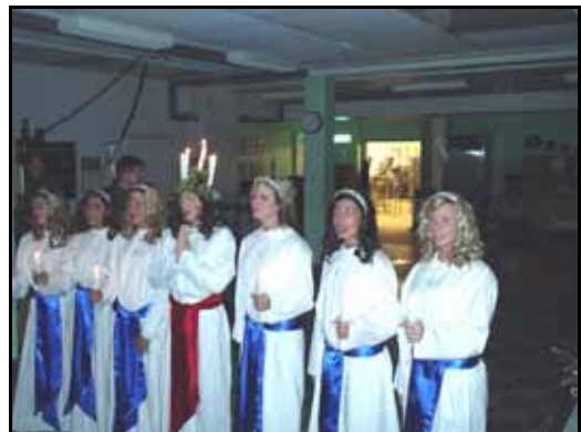
Lucia - och andra julsånger framfördes.