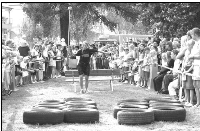
Bild från stadsparken och stadskampen mot Kramfors