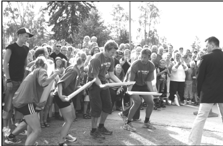
Bild från stadsparken och stadskampen mot Kramfors

läggas ned. Detta blev upptakten till en snabb mobilisering och en massa motförslag. Resultatet av detta blev att BB, förlossning mm blir kvar. Unikt i Sverige att en ort klarat detta, två gånger på kort tid. Detta tycker jag visar på en otrolig styrka hos folket.